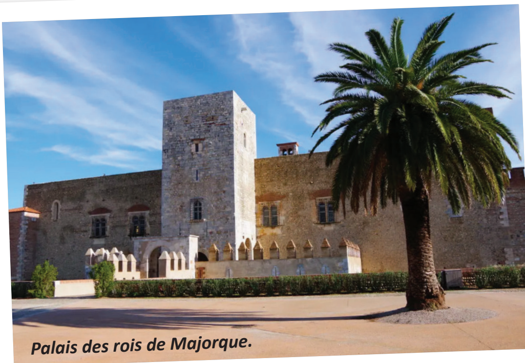
Palais des rois de Majorque.