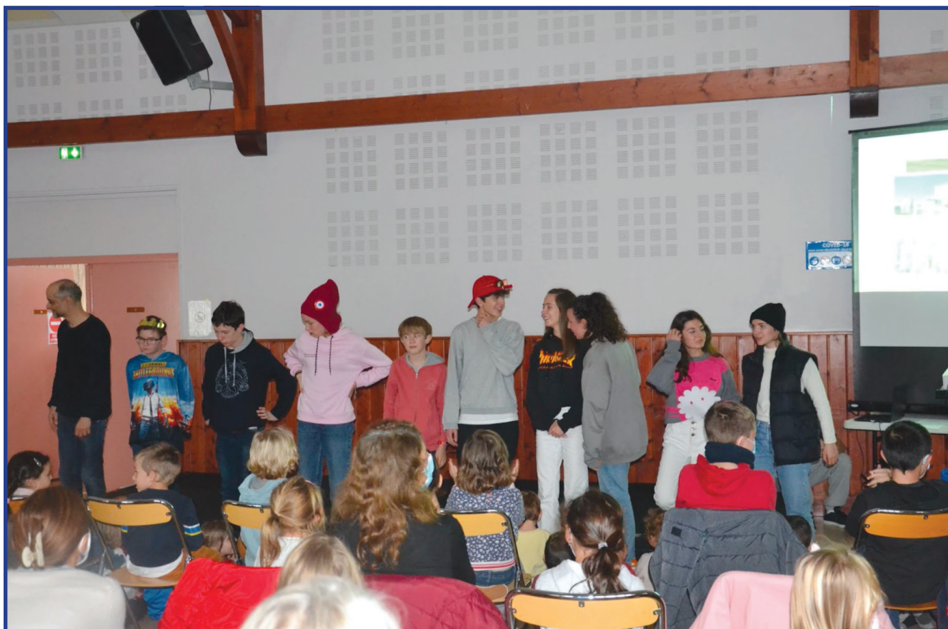
Le CMJ organise un concours de dessins pour les classes de CP, CE 1 et CE 2 de l'école élémentaire Ferdinand-Buisson.