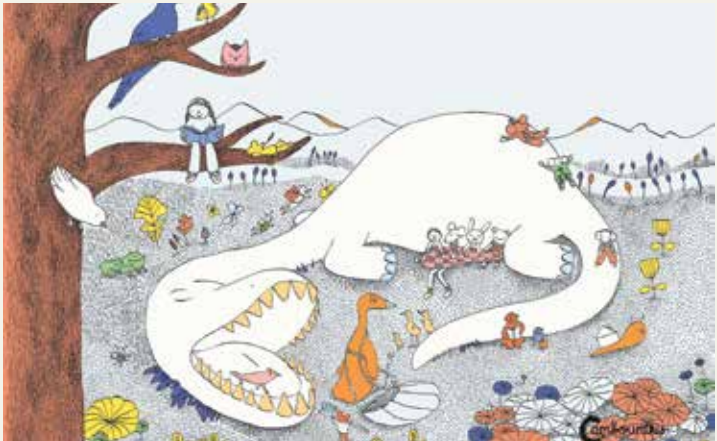
© Hélène Gaudy & Anne Beauchard

Spectacle réalisé en résidence à l'espace Georges Grassens - Feytiat Librement inspiré du livre d' Anne Beauchard et Hélène Gaudy (éditions Cambourakis) De et avec Sandrine Canou Musiques Mélodie du groupe de Hang Métiss , signé Yacha Boeswillwad et comptines populaires